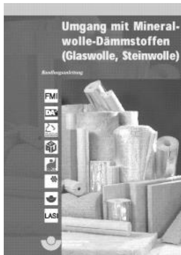
Broschüre "Umgang mit Mineralwolle-Dämmstoffen (Glaswolle, Steinwolle)":

Abfallwirtschaftsbetrieb des Landkreises Rastatt Telefon (0 72 22) 3 81-55 10 Telefax (0 72 22) 3 81-55 99 E-Mail awb@landkreis-rastatt.de www.awb-landkreis-rastatt.de