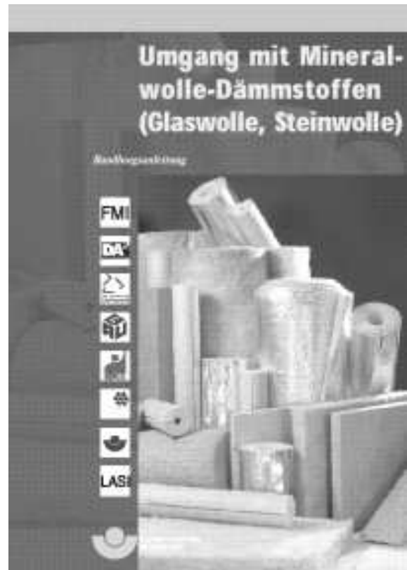
Broschüre "Umgang mit Mineralwolle-Dämmstoffen (Glaswolle, Steinwolle)":

Abfallwirtschaftsbetrieb des Landkreises Rastatt Telefon (0 72 22) 3 81-55 10 Telefax (0 72 22) 3 81-55 99 E-Mail awb@landkreis-rastatt.de www.awb-landkreis-rastatt.de