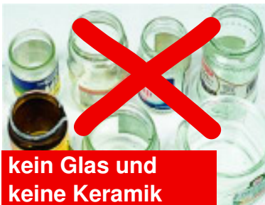
kein Glas und keine Keramik