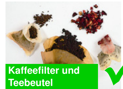
Kaffeefilter und Teebeutel