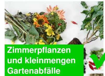
Zimmerpflanzen und kleinsten Gartenabfälle