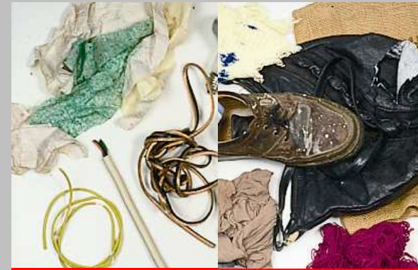
Bodenbeläge, Kabel, Koffer, Taschen, Teppiche, Schuhe