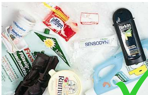
Verpackungen aus Kunststoffen