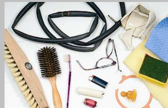
Bürsten, Fahrradmäntel, Lappen, Polster, Schaumstoffe