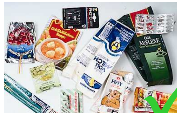
Verbundverpackungen (z.B. Getränketüten)