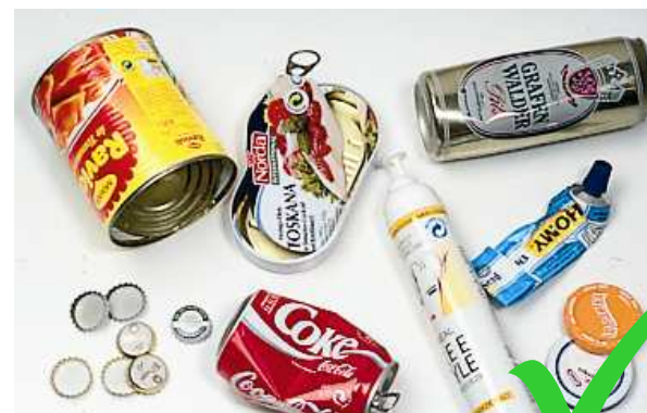
Verpackungen aus Metall